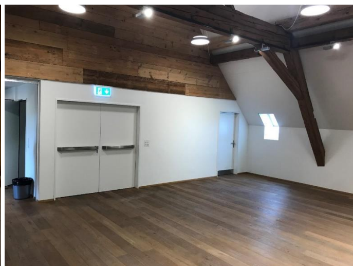
Mehrzweckraum nach der Sanierung