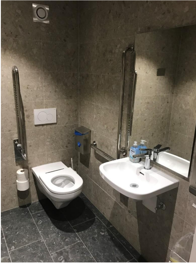
Neue IV WC Anlage