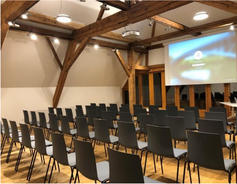
Mehrzweckraum mit Bestuhlung