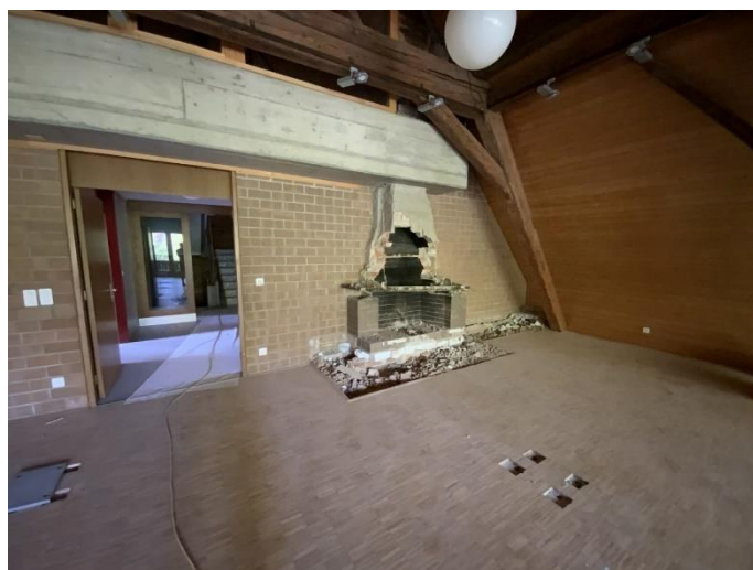
Cheminéeraum vor der Sanierung

Das Kulturangebot im Freizythus wird seither von gross und klein rege genutzt. Die Nutzenden fühlen sich wohl und freuen sich über die neuen Räumlichkeiten. Die Gestaltung ist äusserst gelungen und auch die Bedürfnisse an den Mehrzweckraum konnten optimal berücksichtigt werden.