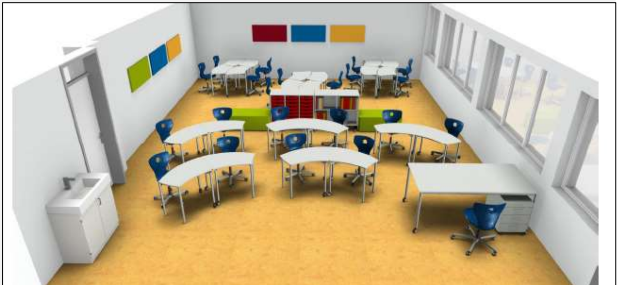
Abbildung unten: Neues Schulmobiliar Schulklasse im Lärchehuus

Das Schulmobiliar von der Firma Knobel ist in der Gemeinde Münsingen neu. Es wurden Erfahrungen im Betrieb gesammelt, damit für die zukünftige Beschaffung von Schulmobiliar Grundlagen bestehen, ob sich dieses eignet. Nach einem Testjahr im Betrieb kann festgehalten werden, dass sich das neue Schulmobiliar bestens eignet. Daher wurde dieses auch für den Neubau Prisma, Schulanlage Schlossmatt, beschafft.