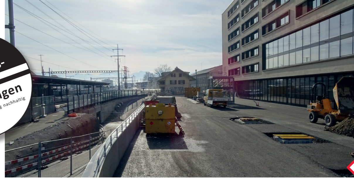
Rampe zur Velostation, darüber der Bahnhofvorplatz West

In den kommenden Monaten wird sich der Bau der Entlastungsstrasse Nord (ESN) stärker bemerkbar machen als bisher: Die Arbeiten am Bahndamm zur Erstellung der SBB-Unterführung erfordern sehr oft Nachtarbeit. An der Hunzigenstrasse startet im April der Strassenbau. Zuvor müssen die Bäume beim Rondell gefällt werden.