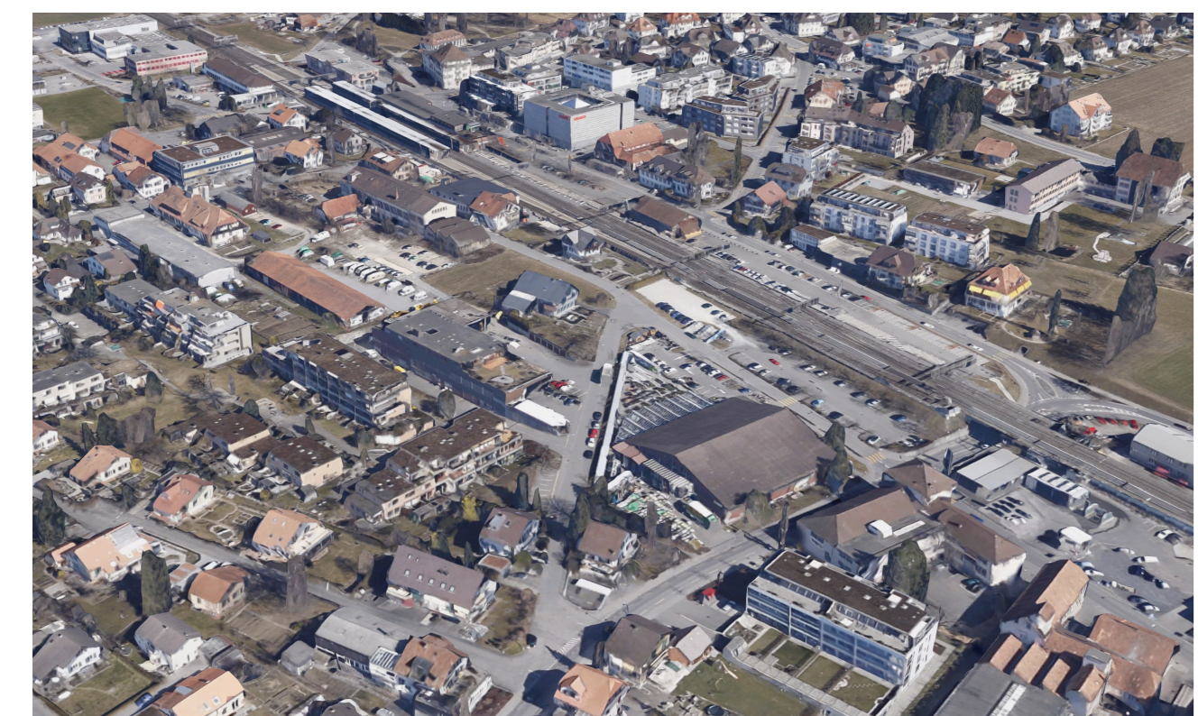
Schrägluftbild, vor Beginn Neubau am Bahnhofplatz West