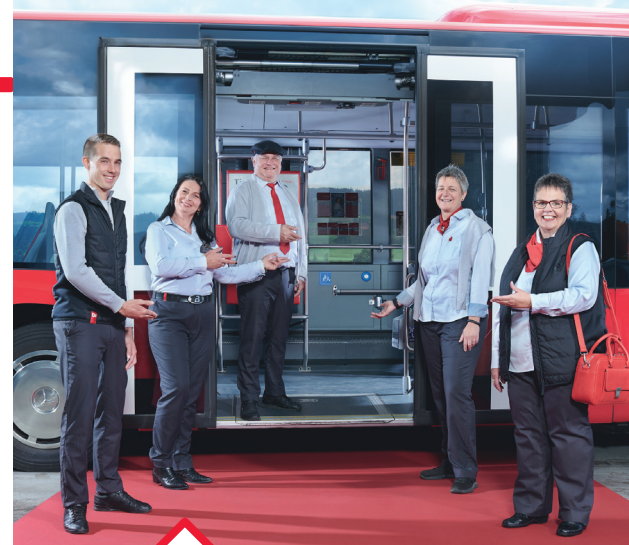
«Grüessech mitenang» — und hereinspaziert. BERNMOBIL freut sich, in Zukunft gemeinsam mit den Fahrgästen in Münsingen unterwegs zu sein.

Der Fahrplan der Linie 163, welche die Quartiere im unteren Dorfteil sowie das Psychiatriezentrum erschliesst, wurde von BERNMOBIL in Abstimmung mit der Gemeinde leicht angepasst. Von Montag bis Freitag kann am Morgen mit dem Bus neu bereits der Zug mit Abfahrt um 06.09 ab Münsingen nach Bern erreicht werden. Die Badi wird während der Badesaison (20. April – 20. September 2020) nur noch stündlich und weiterhin nur auf Verlangen bedient. Der Fahrtwunsch zur Badi bitte beim Einsteigen dem Fahrpersonal melden. Zum Einstieg an der Haltestelle Badi die Ruftaste betätigen.