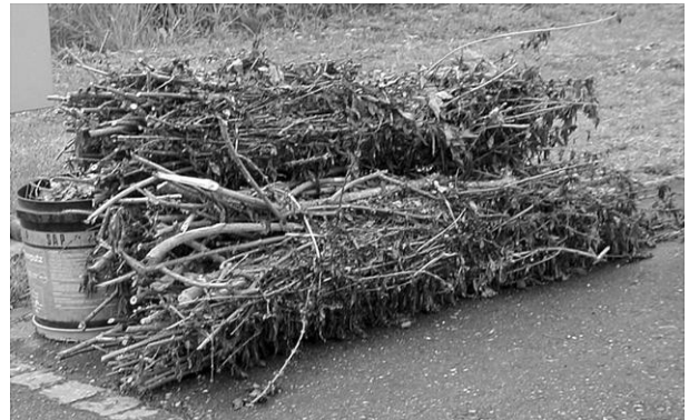
Astmateriale und Sträucherschnitt werden am besten als Bündel bereitgestellt.

Wichtig! Bitte keine Fremdstoffe in die Container werfen (siehe Rückseite).