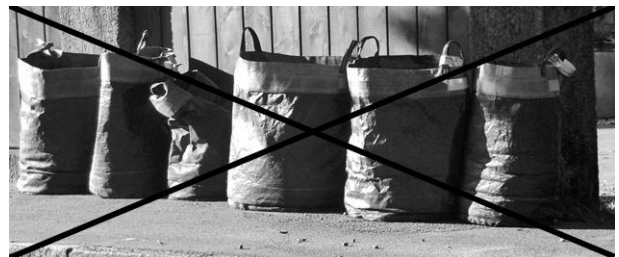
Die Bereitstellung von Grünabfall in Säcken und Taschen ist verboten .

Die Bereitstellung von Grünabfall in Säcken und Taschen ist verboten . Sie lassen sich schlecht anheben und entleeren. In diesen Behältnissen beginnt der biologische Abbau von Grünmaterial bereits vor der Sammlung und verursacht schlechte Gerüche und Hygieneprobleme. Auch das Zurücklassen der geleerten Säcke führt zu Problemen.