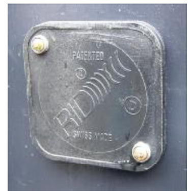
Erkennungseinheit (Transponder) an einem Gewerbekehricht-Container, Grösse ca. 4 x 4 cm

Wichtig: Die Transponder dürfen nicht selber montiert oder ummontiert werden.